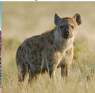
斑鬣狗 Spotted Hyena