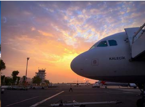
Airport of Djibouti City