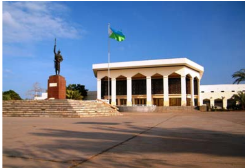
The People's Palace, Djibouti City

從德雷達瓦飛往吉布提的首都吉布提市 Djibouti City，之後在市內參觀。