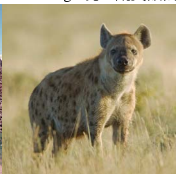
斑鬣狗 Spotted Hyena