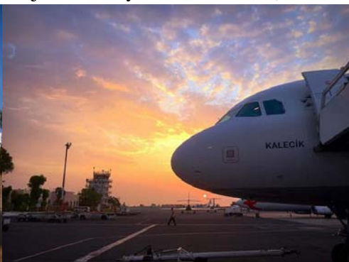
Airport of Djibouti City