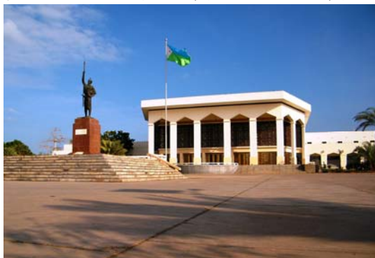
The People's Palace, Djibouti City

從德雷達瓦飛往吉布提的首都吉布提市 Djibouti City，之後在市內參觀。