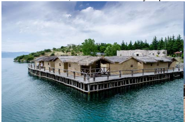
骨頭灣水上博物館

Lake Ohrid*, Bay of Bones, Monastery of Saint Naum, Ancient Theatre, Samuil's Fortress, Church of Saint Panteleimon, Mother of God Perybleptos church, Icon Gallery, Varosh Old Town.