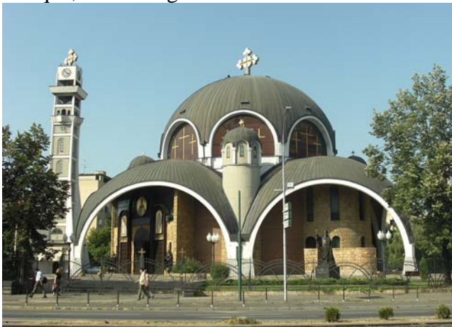
奧荷德聖革利免教堂

斯哥比亞要塞，耶穌升天教堂，穆斯塔法帕夏清真寺，蘇丹穆拉清真寺，馬其頓考古博物館。Skopje Fortress, The Church of the Ascension of Jesus, Mustafa Pasha Mosque, Sultan Murad Mosque, Archeological Museum of Macedonia.