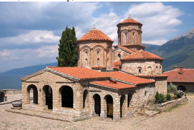
聖潘捷利蒙修道院