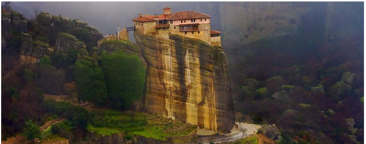
麥提奧拉的修道院

卡蘭巴卡，天空之城麥提奧拉 Meteora*，聖三一修道院 St Trinity Monastery，溫泉關 Thermopylae (列奧尼達及斯巴達三百勇士紀念碑)。