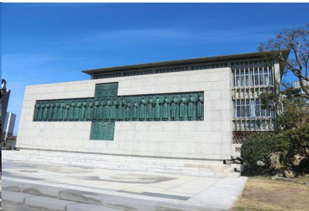
長崎二十六聖人紀念館