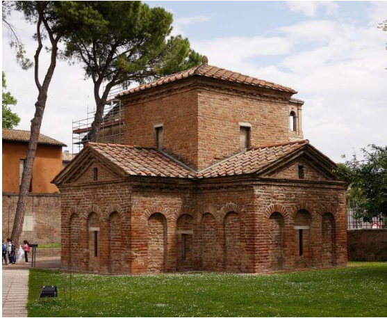
加拉普拉西提阿陵墓 Mausoleum of Galla Placidia

狄奧多里陵墓 Mausoleum of Theodoric*，加拉普拉西提阿陵墓 Mausoleum of Galla Placidia*，聖維塔教堂 Basilica of San Vitale*，Domus dei Tappeti di Pietra