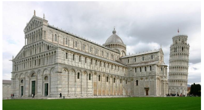
Piazza dei Miracoli*