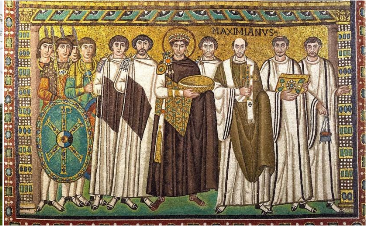
聖維塔教堂 Basilica of San Vitale