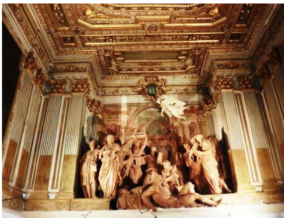
Sanctuary of Santa Maria della Vita