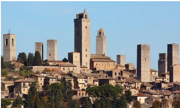
塔樓之城聖吉米亞諾 San Gimignano

美麗的塔樓之城聖吉米亞諾 San Gimignano*，比薩 Pisa*，契安尼娜牛排及試酒 Chianina steak & wine tastings，錫耶納賽馬節場地 Site of the traditional Palio horse race in Siena*