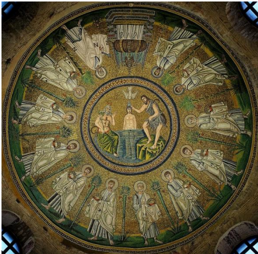
The ceiling mosaic of Arian Baptistry. 6 century AD

亞略洗禮堂 Arian Baptistry*，拉文納現存最古老的古蹟尼安洗禮堂 Baptistry of Neon*，總主教小堂 Archiepiscopal Chapel*，總主教博物館 Archiepiscopal Museum，新聖亞坡理納教堂 Basilica of Sant'Apollinare Nuovo*，人民廣場 Piazza del Popolo