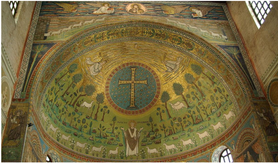
The apse of the Basilica of Sant'Apollinare in Classe. 6 th century AD

但丁墓 Tomb of Dante，聖法蘭西教堂 Basilica of San Francesco，卡斯的聖亞坡理納教堂 Basilica of Sant'Apollinare in Classe*，博洛尼亞古城牆 Porticoes and City Walls*，聖路加的聖母聖所 Sanctuary of the Madonna of Luca