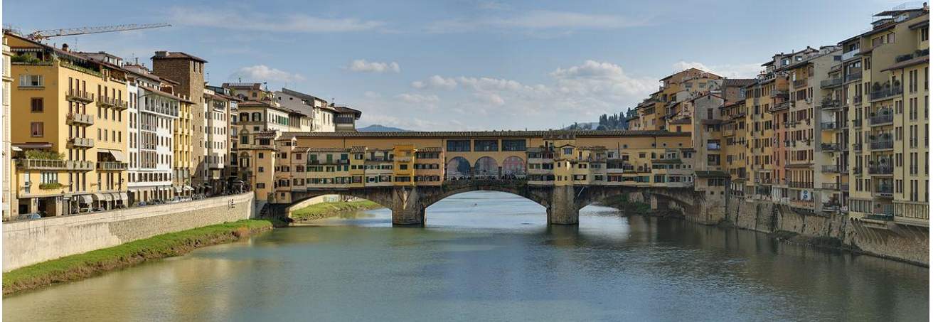
佛羅倫斯最古老的維奇歐橋 Ponte Vecchio

巴傑羅美術館 Museo Nazionale del Bargello，領主廣場 Piazza della Signoria，海神噴泉 Fountain of Neptune，維奇歐宮 Palazzo Vecchio，佛羅倫斯最古老的維奇歐橋 Ponte Vecchio，Basilica of Holy Trinity，烏菲茲美術館 Uffizi Gallery，安葬了米高安哲奴、伽利略等名人的聖十字教堂 Basilica of the Holy Cross (Basilica di Santa Croce)，米高安哲奴廣場 Piazzale Michelangelo (Michelangelo Square) 看夜景