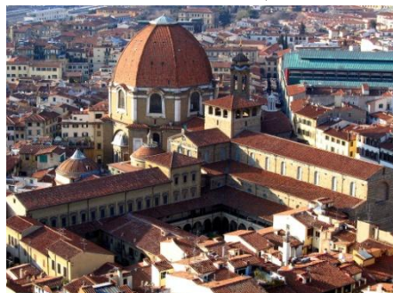
聖羅倫斯大教堂 Basilica of Saint Lawrence (Basilica di San Lorenzo)