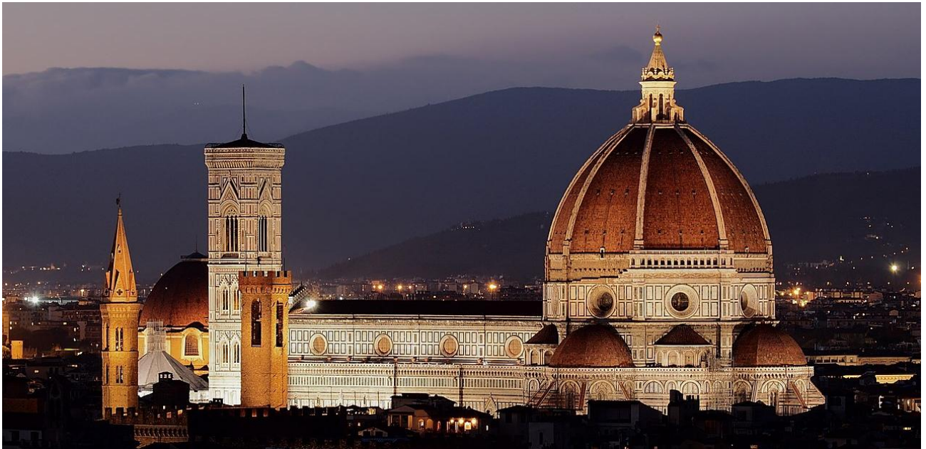
聖母百花大教堂 Florence Cathedral