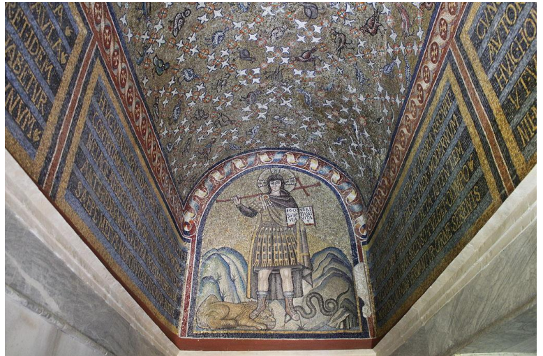
Mosaic of St. Andrew in Archiepiscopal Chapel. 6th century AD