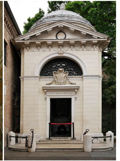
但丁墓 Tomb of Dante