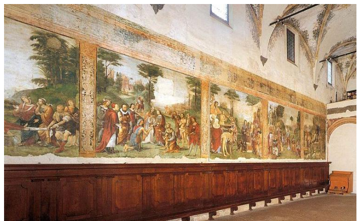
Oratory of Saints Cecilia and Valeriano