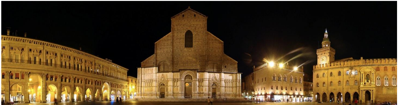
馬芝奧利廣場 Piazza Maggiore

馬芝奧利廣場 Piazza Maggiore and its buildings (Palazzo del Podestà, Palazzo dei Banchi, 亞古斯奧宮 Palazzo d'Accursio, Palazzo dei Notai), 海神噴泉 Piazza Nettuno and King's Enzo Palace, Sala Borsa and Roman remains of Bononia, 阿奇吉納西歐宮 The Archiginnasio and the Anatomical Theater, 聖斯德望廣場 Piazza Santo Stefano and the medieval complex of churches and cloister, 博洛尼亞考古博物館 Bologna Archaeological Museum, The Quadrilatero (food and market area), Sanctuary of Santa Maria della Vita, Basilica of San Giacomo Maggiore, Oratory of Saints Cecilia and Valeriano, 聖多明我教堂 Basilica of San Domenico。 晚上前往機場，乘航空客機飛返原居地。