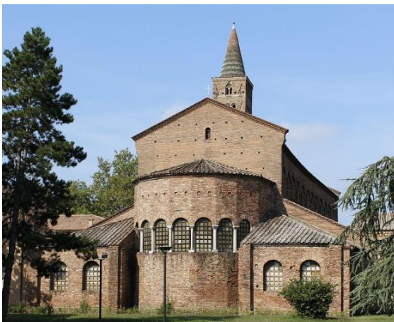
聖約翰傳道者教堂

聖約翰傳道者教堂 Church of Saint John the Evangelist (San Giovanni Evangelista, the first recorded Christian use of hooked crosses)，Tamo Museo del Mosaico，拉文納國家博物館 National Museum of Ravenna