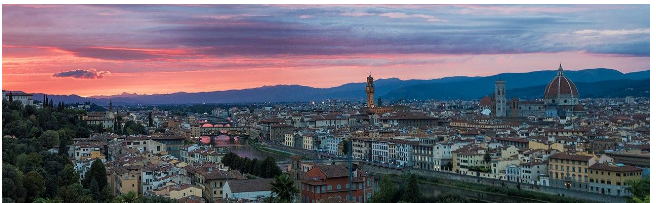
米高安哲奴廣場 Piazzale Michelangelo (Michelangelo Square)