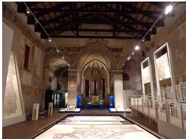
Tamo Museo del Mosaico